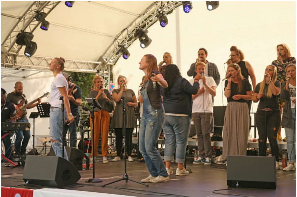
HeartChoir beim Seefest