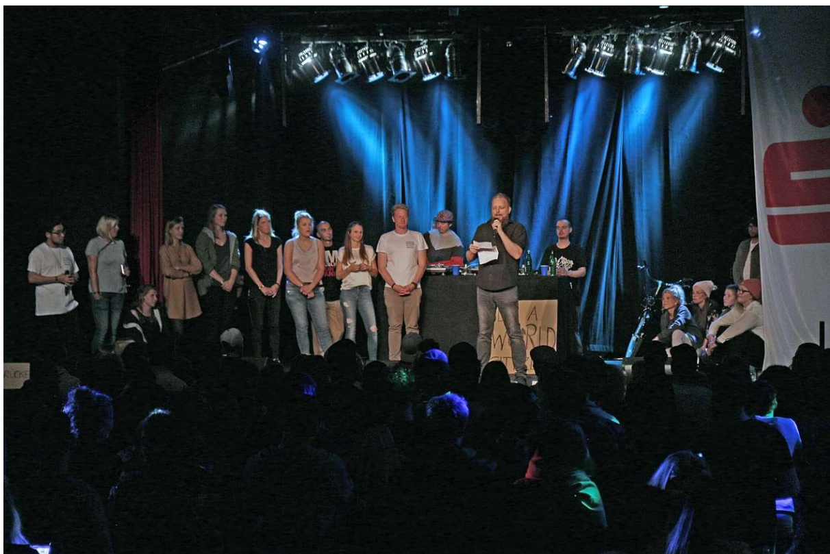
Bass Gegen Hass 02.09.18