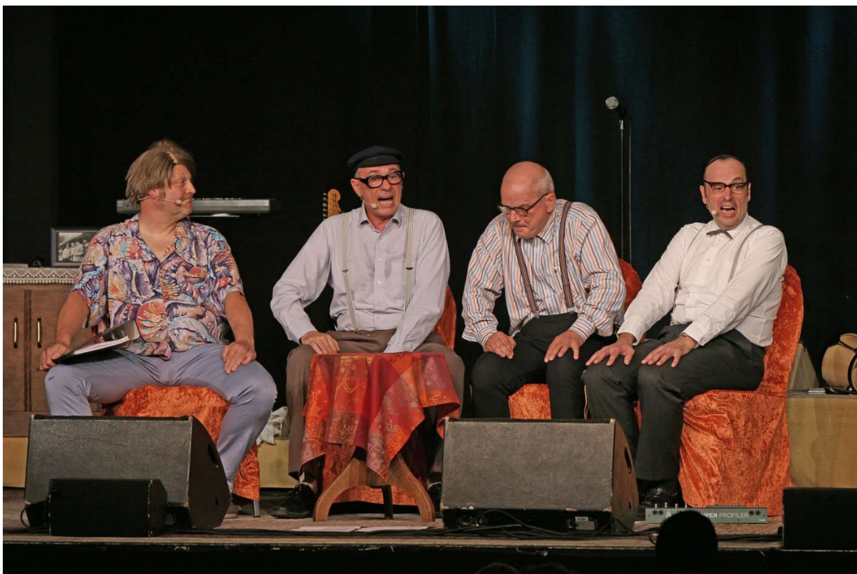
Herbert Knebel 22.09. und 23.09.2018