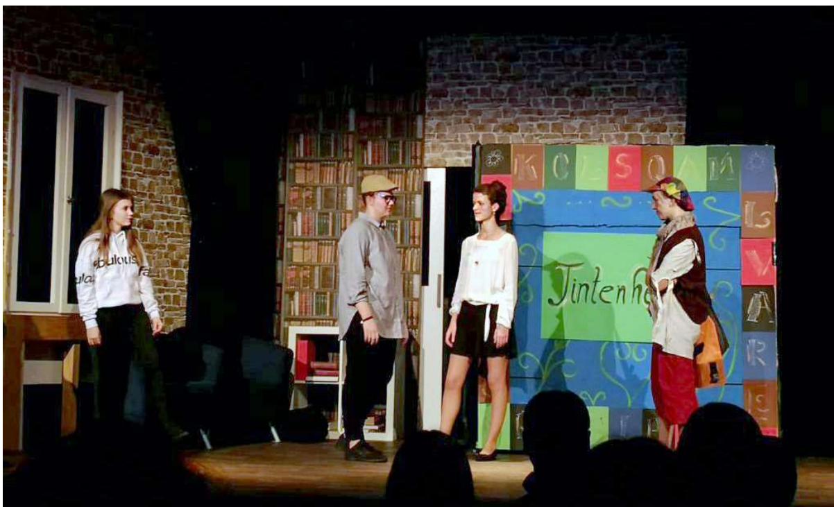
YAC - Tintenherz